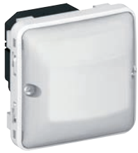
0 695 00