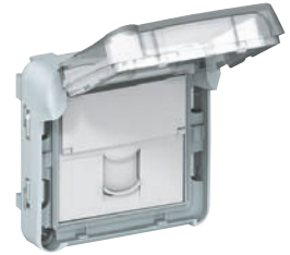
0 695 69

A mechanizmusokat burkolattal együtt szállítjuk Felszerelés falon kívüli dobozzal (448. oldal) vagy falba süllyesztve kerettel (448. oldal) Glimmlámpák és kiegészítők (450. oldal) Rugós vezetékbeiktetéssel