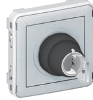
0 695 34