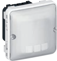
0 695 02