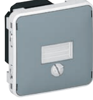
0 695 17